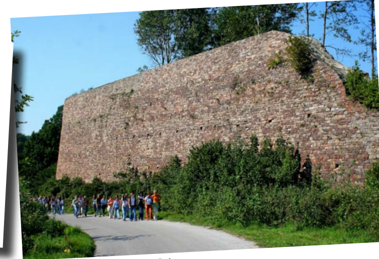
Monumentalny mur oporowy w Bobrzy.

Opisywana miejscowość jest położona u stóp Baraniej Góry, objętej ochroną jako rezerwat przyrody o tej samej nazwie. Będąc w Obłęgorku warto się tam wybrać nie tylko ze względu na piękny las bukowy ale też ze względu na jedne z najpiękniejszych widoków w Górach Świętokrzyskich ze szczytu Baraniej Góry.