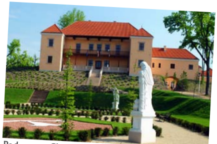
Podzamcze Chęcińskie, widok z ogrodów na pałac.

Drugi obecnie działający klasztor Bernardynek (dawniej Kларыsek) założono przy kościele św. Marii Magdaleny i wybudowano najprawdopodobniej w XVI w.