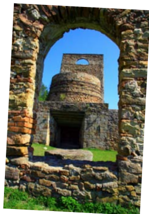
Samsonów, ruiny XIX-wiecznej huty.